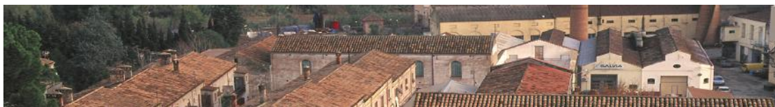
Esparreguera. La Colònia Sedó