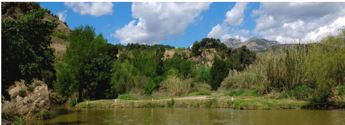
Esparreguera. El Llobregat amb Montserrat al fons